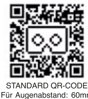
Bild Probleme? Teste weitere QR-Codes von der nächsten Seite dieser Anleitung oder weitere QR-Codes und Hilfe unter http://QR.vrprimus.com